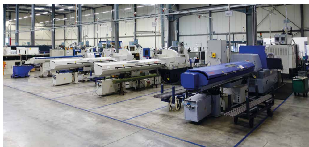
Il parco macchine di WIGGENTech comprende circa 20 torni mono e plurimandrino