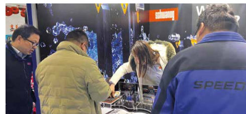
CME - International machine tool exhibition, China