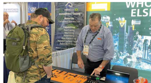
Shot Show, Las Vegas