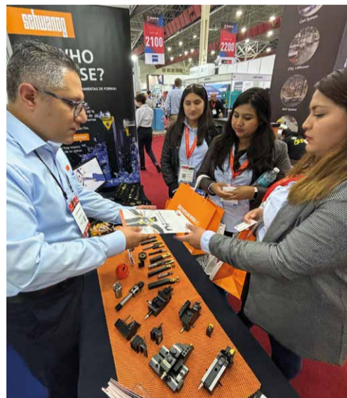
EXPO Manufactura, Monterrey