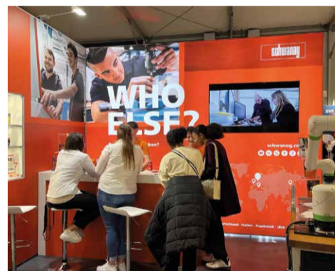
Fiera dell'apprendistato Jobs for Future a Villingen-Schwenningen