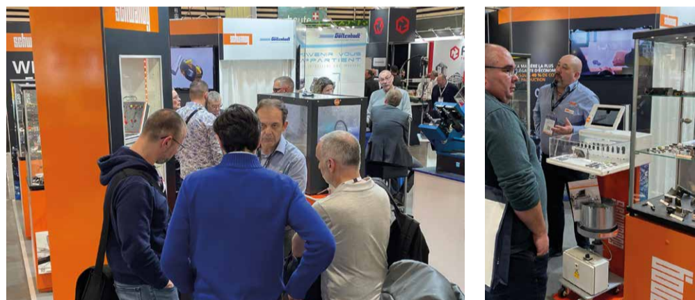
Simodec, La Roche-Sur-Foron

Con i primi appuntamenti fieristici di quest'anno appena cominciato, abbiamo riscontrato un chiaro desiderio di soluzioni sostanziali per la produttività. I nostri team fieristici hanno registrato un elevato numero di visitatori: allo Shot Show di Las Vegas, all'Expo Mexico, a Fornitore Offresi e Mecspe in Italia, a Simodec in Francia o a CME in Cina.