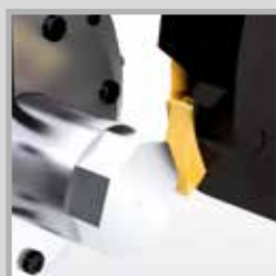
Frézování vícehranů na soustruhu