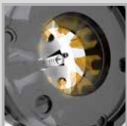
Frézování vnějších závitů