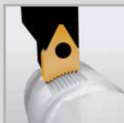
Obrázení jemného vroubkování hřídelí