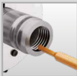
Frézování vnitřních závitů