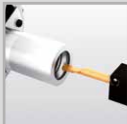
Vnitřní zapichování a soustružení