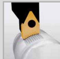
Stozzatura per ingranaggi