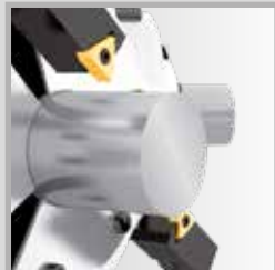
Scanalatura esterna su macchine transfer