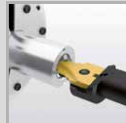
Foratura di forma