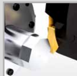
Fresa per poligonatura