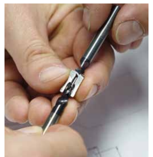
Proyecto actual con brocas de metal duro integral de Schwanog