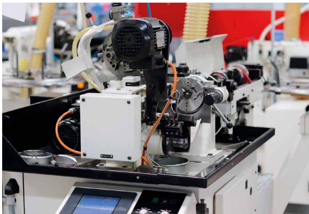
Máquina ESCOMATIC D2

Los clientes interesados recibirán el asesoramiento profesional del equipo de Schwanog a través de todos los canales de comunicación, ya sea personalmente in situ, en Schwanog, telefónicamente o mediante videoconferencia.