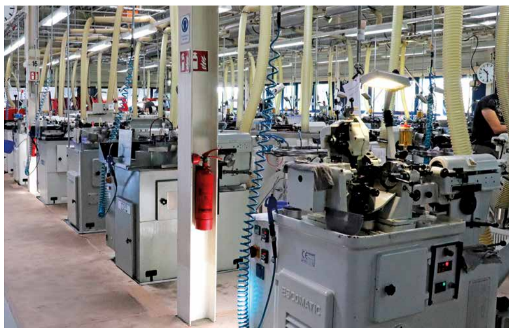
Parque de máquinas ESCO Haller-Jauch GmbH

Especialmente: cuanto más difícil sea el material a mecanizar, mayor es el ahorro de costes de herramientas"