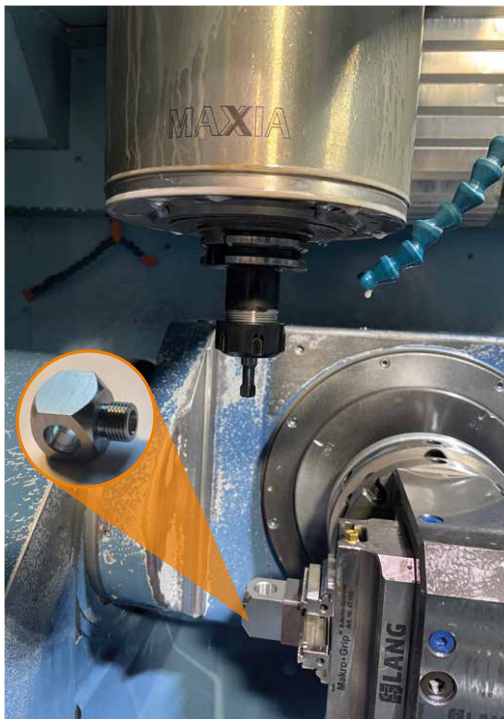
Zastosowanie w Hydrokomp z frezem kształtowym Schwanog

Obie firmy uzgodniły jeszcze ściślejszą współpracę w przyszłości i ustalanie dalszych możliwości obniżki redukcji kosztów jednostkowych oraz optymalizacji procesów.