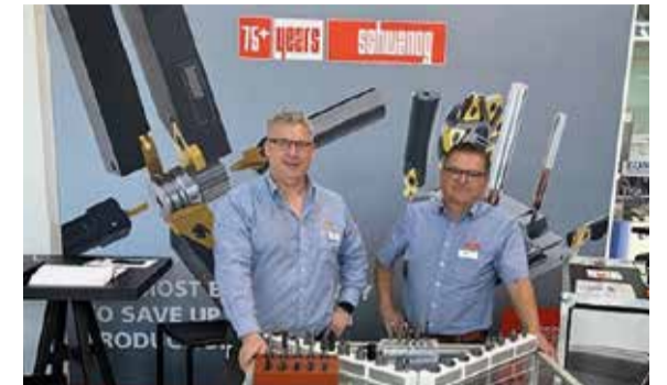
Mitausteller Index Open House in Deizisau