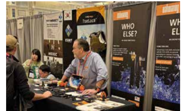
Shot Show, Las Vegas, USA