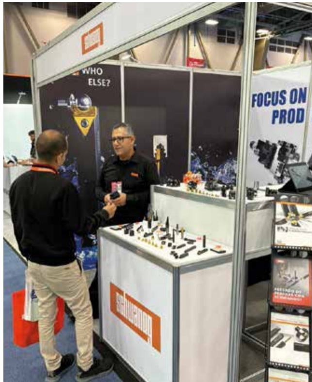
Expo Manufactura – Mexico